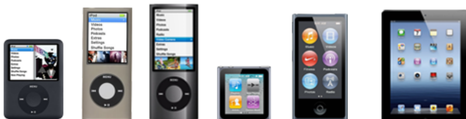
Nano 3G Nano 4G Nano 5G Nano 6G Nano 7G iPad 1/2/3