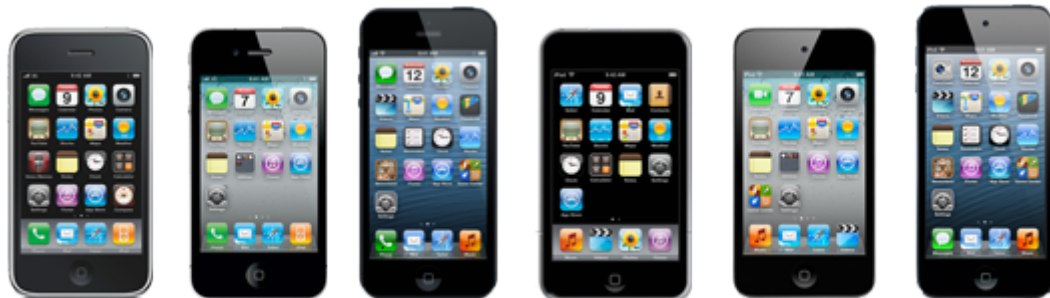
iPhone 3G/3GS iPhone 4G/4GS iPhone 5 Touch 2G/3G Touch 4G Touch 5G