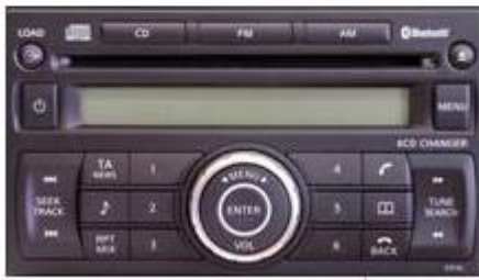
CY11C (PP-2804T) (6disk)