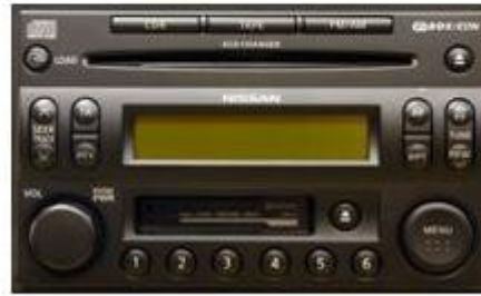
CR07A (PP-2609H), CR09B (PN-2736H)