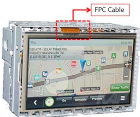
Capacitive touch screen