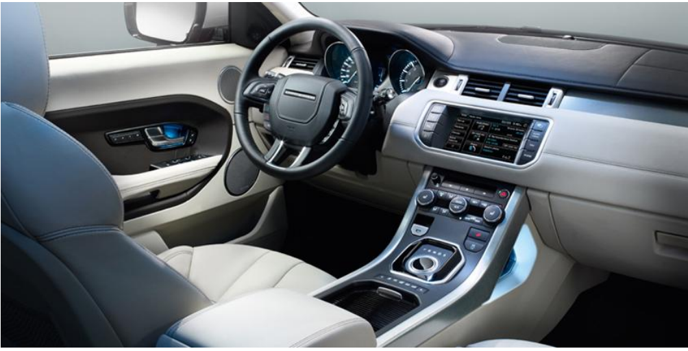
Range Rover Sports