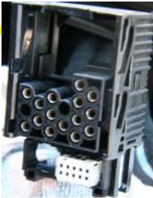
Aansluiting interface 10-pins wisselaar aansluiting radio: