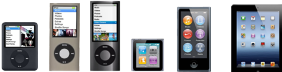
Nano 3G Nano 4G Nano 5G Nano 6G Nano 7G iPad 1/2/3