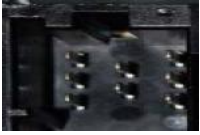
Afbeelding 8-pins wisselaar aansluiting interface: