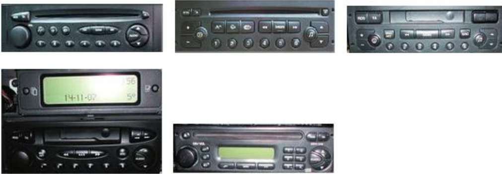
Niet geschikt voor de volgende modellen/systemen:

RC220 / 220 / 260 / 280 / 290 / PU2294 / 1633 (RD3)