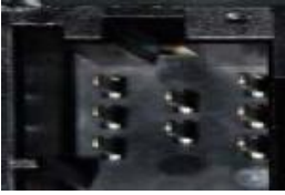
Afbeelding 8-pins wisselaar aansluiting interface: