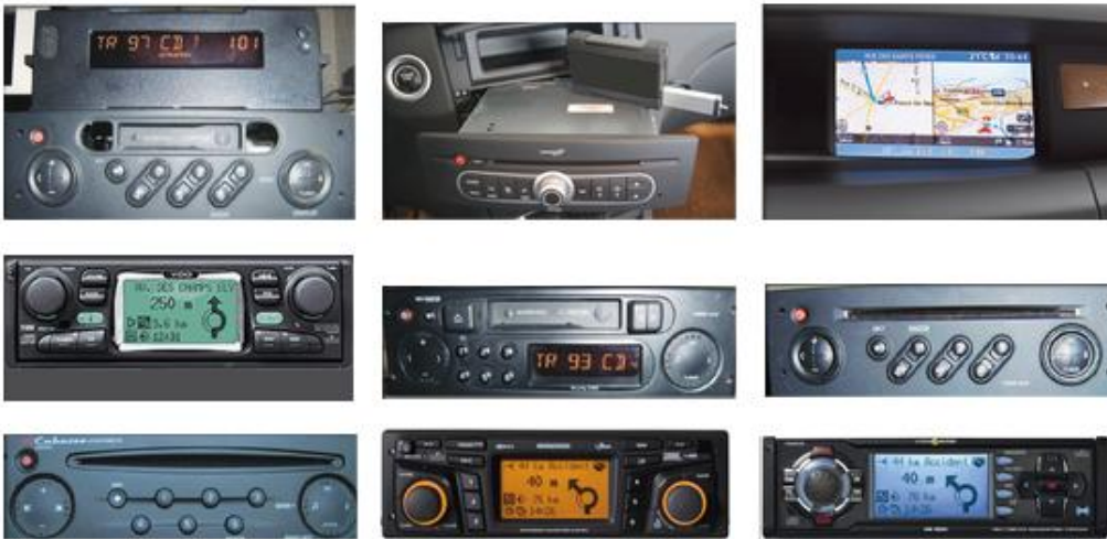
Niet geschikt voor de volgende modellen/systemen: