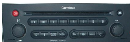
Carminat Monochrome radio: