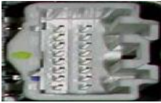
Afbeelding 16-pins wisselaar aansluiting interface: